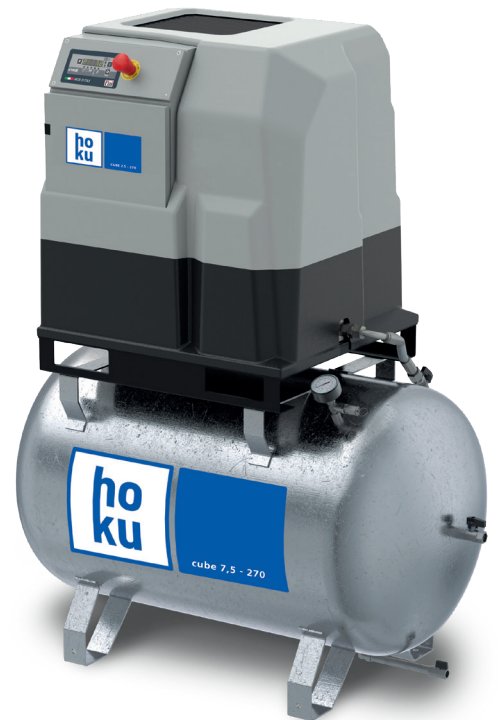
hoku CUBE 7.5-270

Höchstdruck 10 bar, Effektive Liefermenge 1050 l/min., Motorleistung 7,5 kW, Geräuscentwicklung 67 dB(A), Maße (L x B x H) 1200 x 600 x 1500 mm, Anschluss 1/2", Behälterinhalt 270 l, Gewicht 211 kg