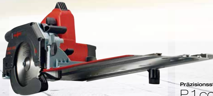
Kappschiene-Säge KSS 40 18M bl im T-MAX Art.Nr.: 919801