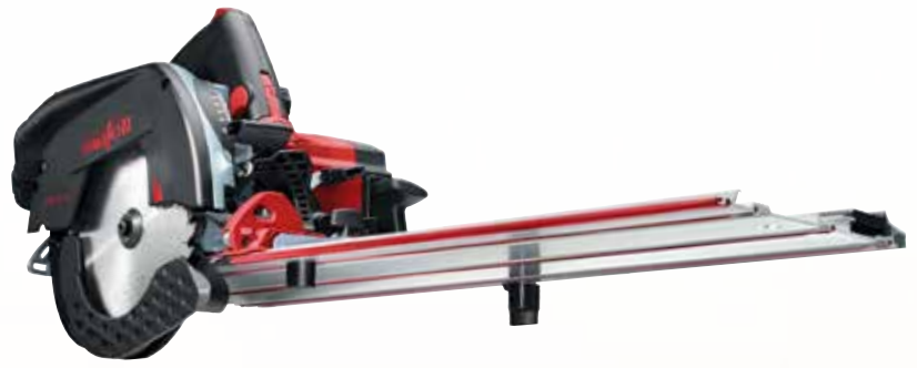
Kappschiene-Säge KSS 50 18M bl