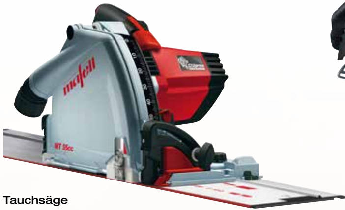
Tauchsäge MT 55 cc MidiMAX im T-MAX mit F 160