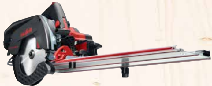
Kappschiene-Säge KSS 60 18M bl