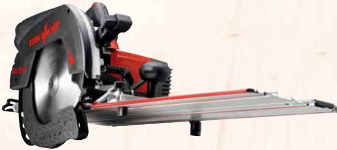
Kappschiene-Säge KSS 80 cc /370